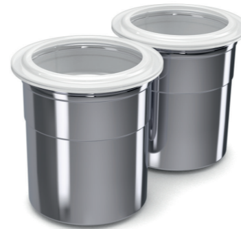
2 Krom stålkipper med deksel