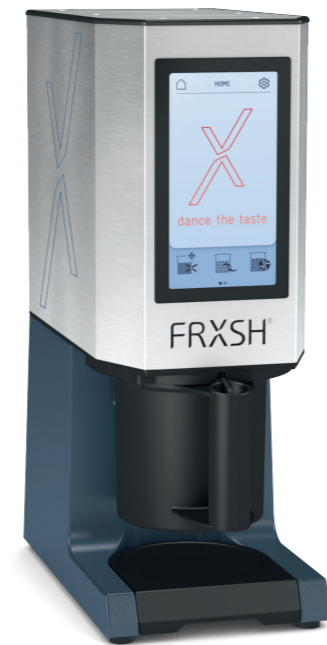
FRXSH Mousse Chef med beskyttende beger